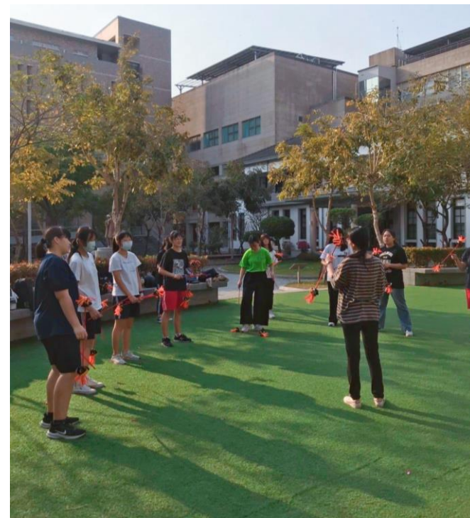
國立臺南 護理專科學校