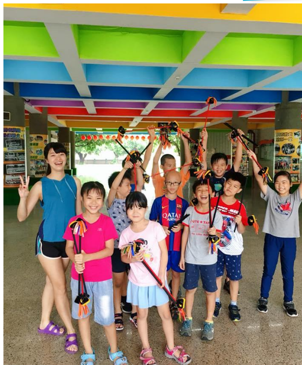
台南市永康區 復興國小