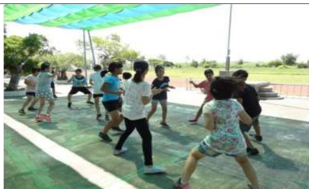
說明：基礎動作練習