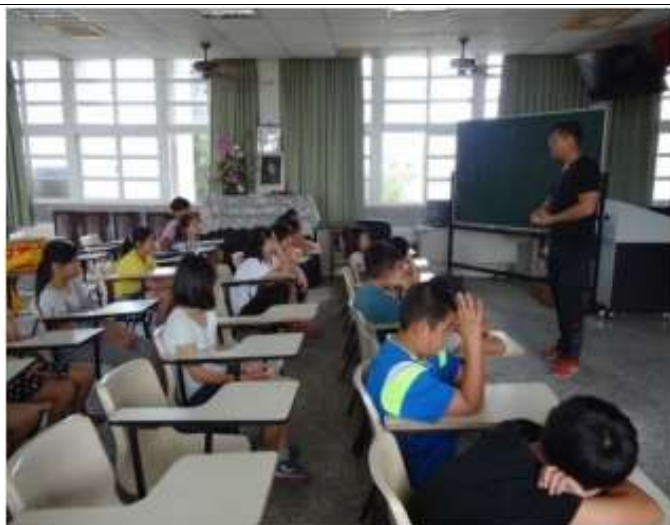
說明：與學生討論跳鼓陣