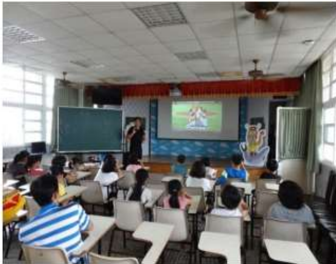
說明：觀賞跳鼓陣影片