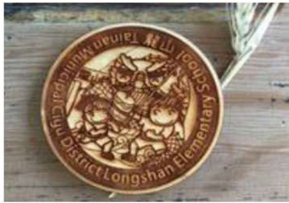
說明：龍山文創商品