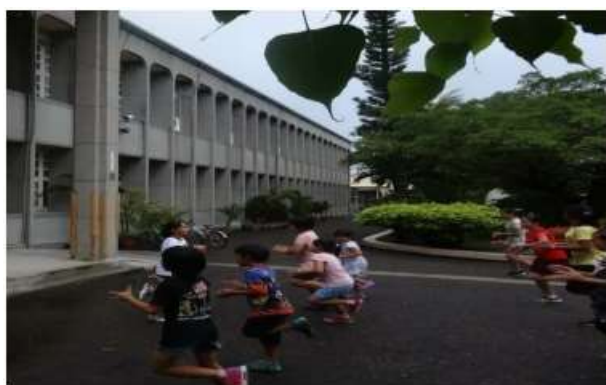
說明：練習跳鼓陣動作