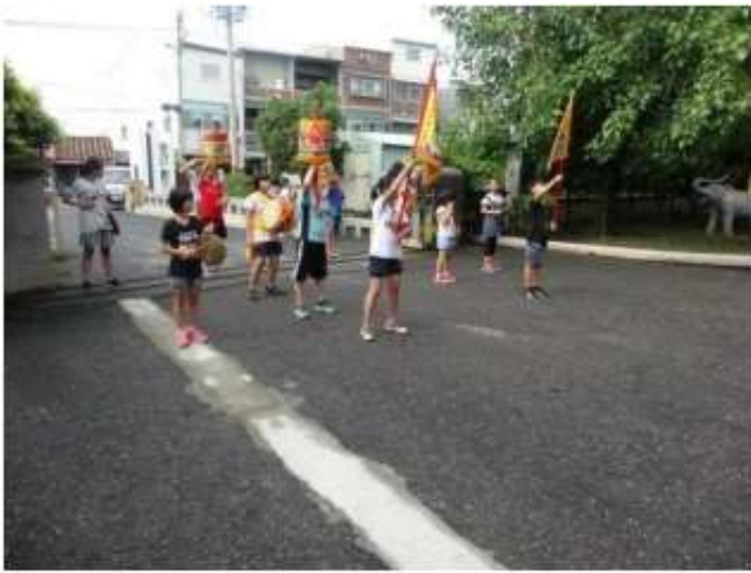
說明：分組演練成果