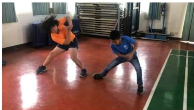
說明：基礎動作練習