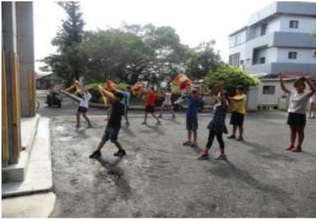
說明：拜廟動作練習