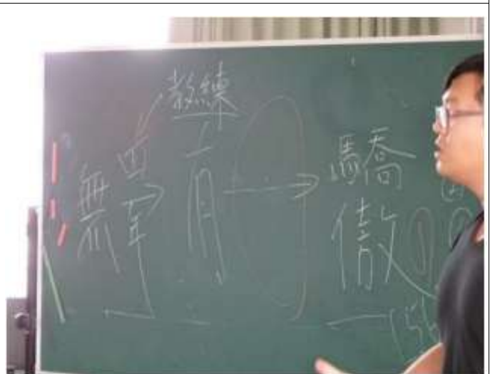
說明：跳鼓陣練習過程說明