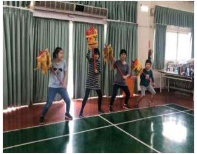
說明：各項器械練習