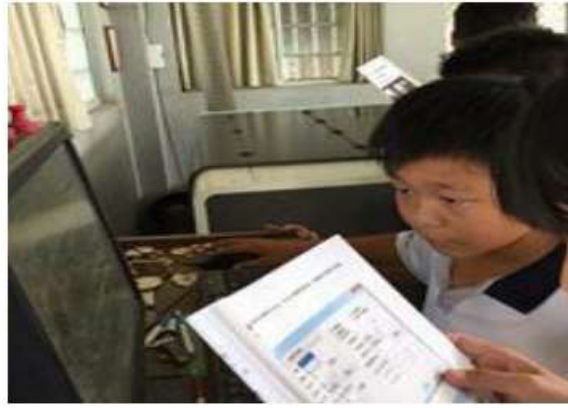
說明：依照說明書設定雷射機