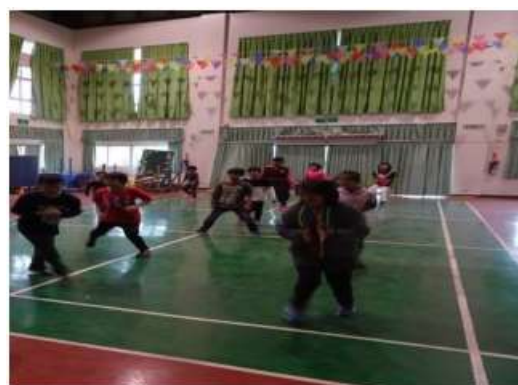
說明：基礎動作練習