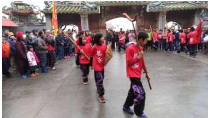
↑ 百年古剎碧雲寺落地掃演出