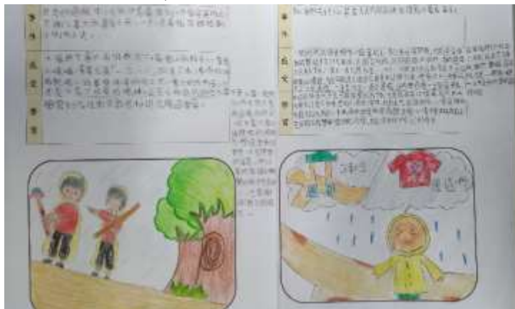
↑ 課程完成後之學習單