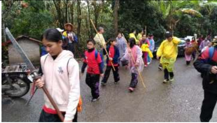
↑ 14.6 公里限時健行遶境