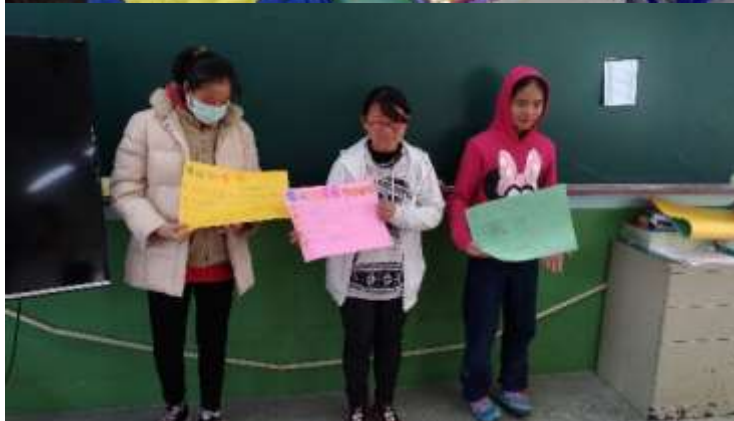
↑ 利用平板搜尋資料製作報告