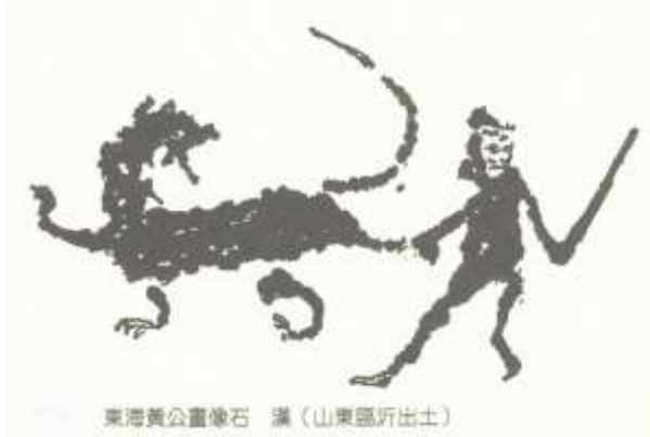
東海黃公畫象石 漢 (山東臨沂出土)

分析漢馴獸圖—「東海黃公畫象石」和漢百戲圖(猛獸瑞獸舞蹈)與北魏(西元 534 - 550)的百戲圖；踏躡、上竿、跳丸之類和猛獸(含獅子)型像放在一起的舞蹈，其情景是十分類似的，所以在北魏時獅子與百戲之間應已有相當程度的關連性存在了。據此，獅子舞至少在曹魏時期已經在中國出現。