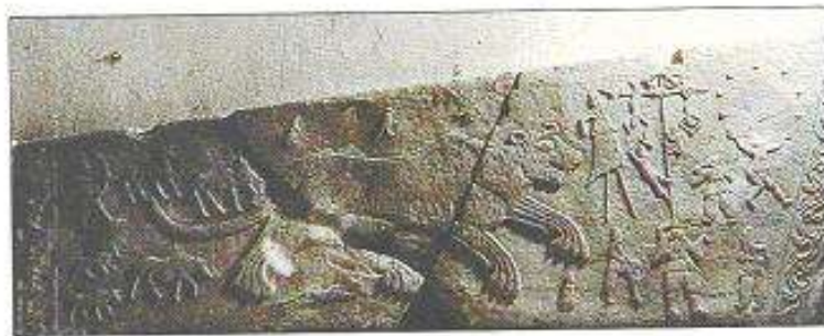
高陵 榆社县石所刻 (北魏)

(摘自：董錫玖 劉竣驥 主編 中國藝術史圖鑒 湖南教育出版社 1997 p40)