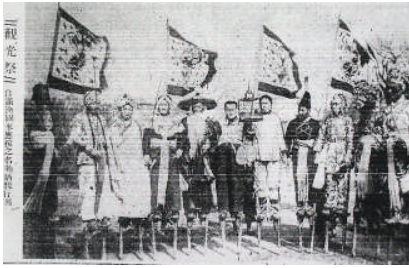
圖 6、觀光祭 自滿洲國來應援之名物踏蹺行列

昭和 11 年 4 月 28 日有另一則照片名為「觀光祭 自滿洲國來應援之名物踏蹺行列」，同樣是介紹滿洲國的高蹺秧歌隊（圖 6）。