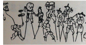
圖 3 明月和尚渡柳蟾，漁樵耕讀等形象

清代走會之風更勝於明代，其規模更大，會目更多，活動更經常化；特別是以八旗子弟為首的皇會，得到清政府的青睞，聲勢浩大，設備堂皇。如果說明代走會偏重抬閣展覽，清代走會則偏重於技藝演出。