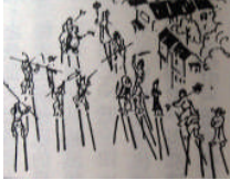
圖 2、孫悟空大鬧天宮，水滸等形象

此外，迎神賽會的風貌，在明代畫家仇英繪製風俗畫 南都繁會圖 中有十分細緻的描繪：勢如長龍的走會隊伍，穿街過巷蜿蜒流動在長街上，隔一段距離就有一隊高蹺藝人前導開路，其中一隊正表演著「安天會」、「孫悟空大鬧天宮」、「水滸」、「三戰呂布」等(圖 2)。 14 另一隊高蹺表演，則有明月和尚渡柳蟾，漁樵耕讀等形象(圖 3)。 南都繁會圖 反映了明代賽會狀況，也反映了雜技在走會中的主導作用。