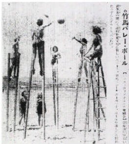
圖4、外國女子踩蹺打排球

1934年，昭和9年7月4日，奇聞異事介紹加州海邊一群外國女子踩在竹馬 高蹺 上打排球的照片。連裁判都坐在高高的梯子上（圖4）。