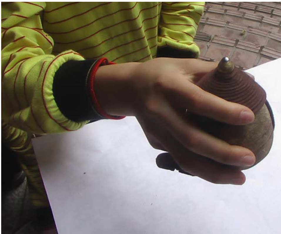
改良式纏繩順序示意圖

以此要領繼續往上纏繩，大約纏到第一條刻線與底部的中間位置即可，最後繩扣在右手食、中指張開夾住線端。