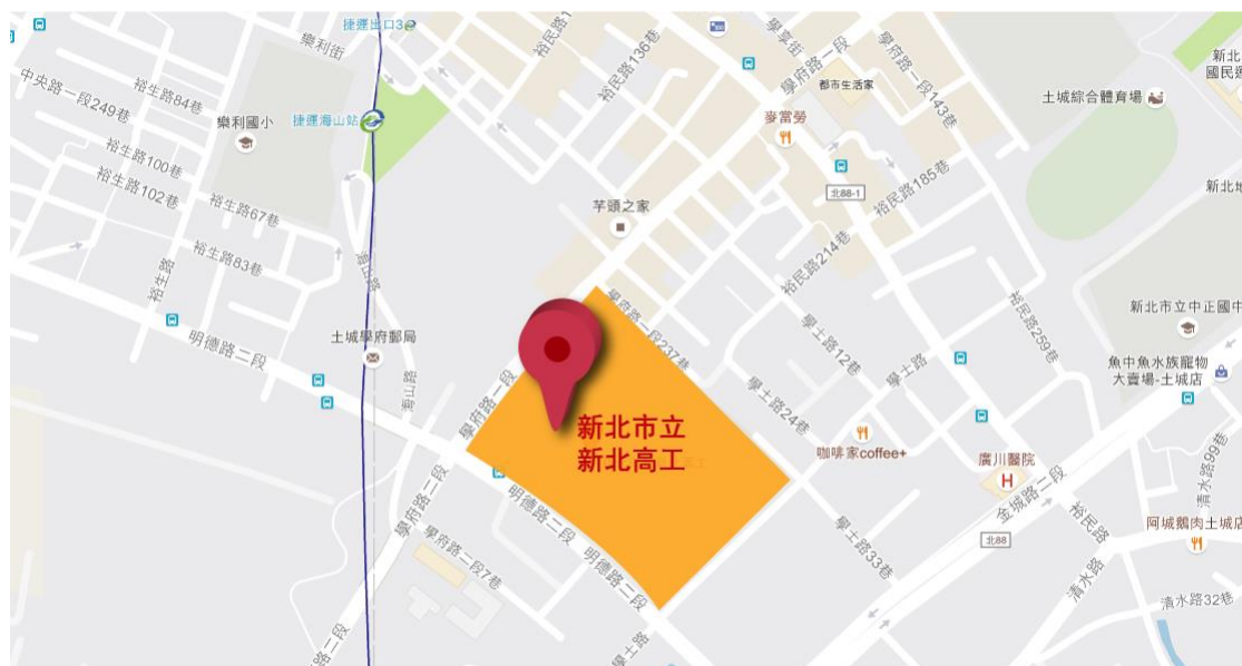
新北高工 校園各教學區示意圖